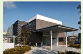
くらしき総合福祉専門学校