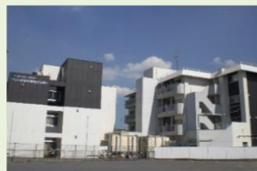
つらじま総合福祉センター