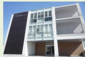
かんだ総合福祉センター