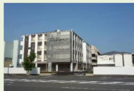
みずしま総合福祉センター