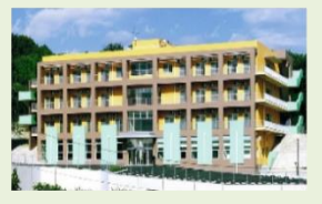
特別養護老人ホーム太陽の丘