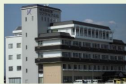
介護老人保健施設 サンライフ倉敷