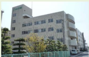
特別養護老人ホーム みどり荘