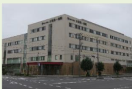
水島第一病院 介護老人保健施設 みずいちりハビリ苑