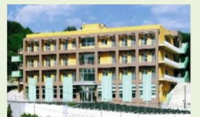
特別養護老人ホーム太陽の丘