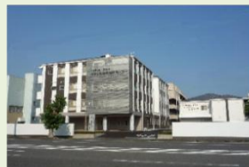
みずしま総合福祉センター