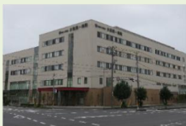
水島第一病院 介護老人保健施設 みずいちりハビリ苑